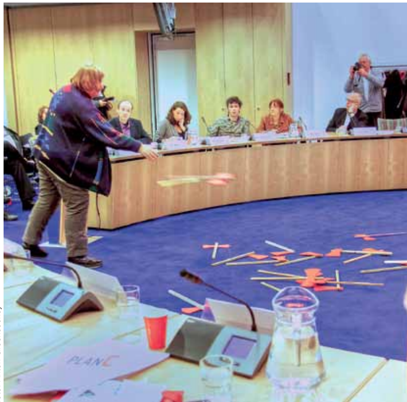
Bijltjes in de vergadering van de deelraad Zuid

Na een paar vaste agendapunten kwamen de twaalf insprekers aan de beurt. Op een enkele uitzondering na spraken de meeste burgers over de bezuinigingen op het vrijwilligerswerk. De Diamantbuurt was met meerdere sprekers