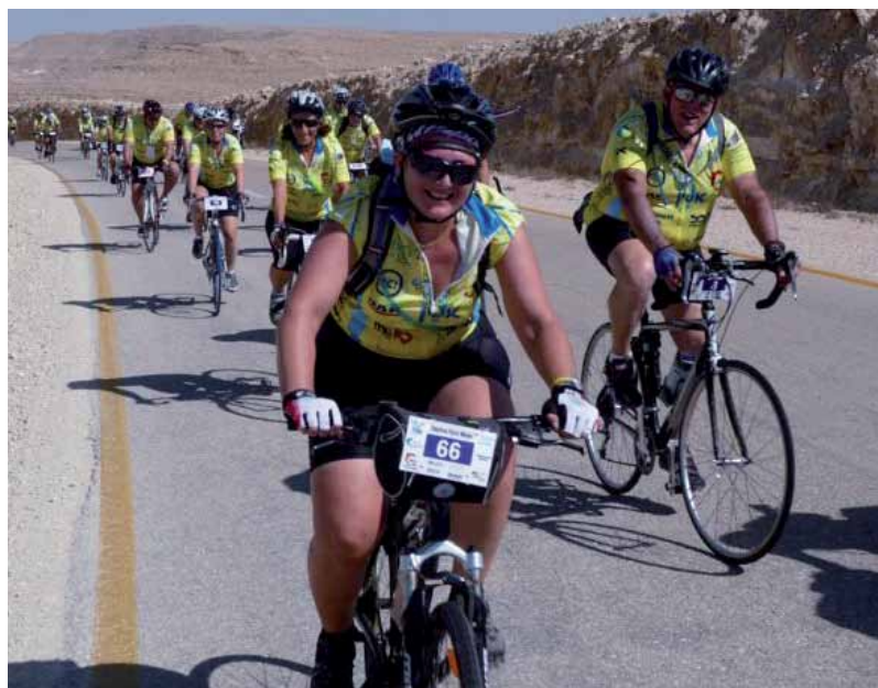
Fietsen in de Negevwoestijn

'Wheels of Love'. Zo heet de jaarlijkse vijfdaagse sponsor-fietsocht in Israël voor lichamelijk gehandicapte kinde-