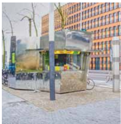
Turkse snackbar op het Mahlerplein

De Turkse snackbar die erin zit is een onderdeel van Döner Company, dat nog een tweede vestiging in Amsterdam heeft, in de Kinkerstraat tegenover de Hema. Buiten de stad zijn er nog veel meer vestigingen, vooral in de Randstad.